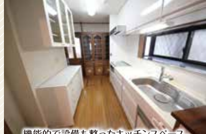
機能的で設備も整ったキッチンスペース。収納も豊富でキッチンワークもはかどります。