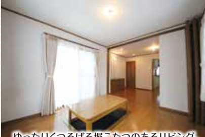
ゆったりくつろげる堀こたつのあるリビング。LDKは開放的で広々18.3帖。