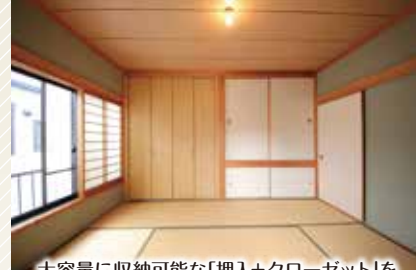
大容量に収納可能な「押入+クローゼット」を配した2階和室。

Life Information JR総武線「本八幡」駅…約1,180m(徒歩15分) 京成本線「鬼越」駅…約280m(徒歩4分) ニッケコルトンプラザ…約370m(徒歩5分) 市川インター…約1,660m