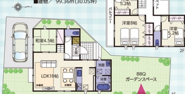
【施工イメージパース】