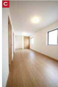
C お子さんの成長に合わせて 「2Way動線」がおすすめです。