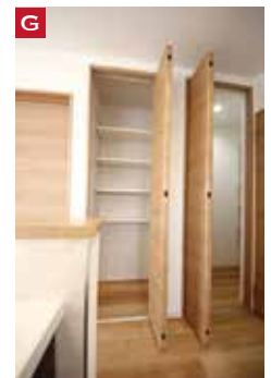
G ものっこの「パントリー」に「物入れ」を収納は完璧です。