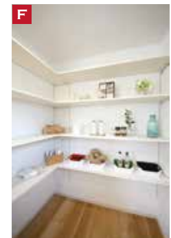
F L型の可動棚の「パントリー」は、見せる収納と隠す収納で使えますね