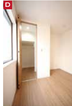
D ファミリー クロークにも なりそうな 「大きめのWIC」