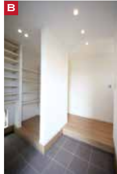
B 2Way動線の「シューズクローク」には、 アウトドア用品も片付けやすいです。