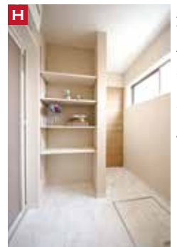
H 洗面室の「オープン収納」は、カゴを上手に使うとリネン庫になります