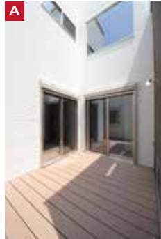
A 中庭の「ウッドデッキ」で プール遊びが楽しめます!!

No.14 3LDK+ WIC+カースペース 敷地面積/117.21㎡(35.45坪) 建物面積/99.78㎡(30.18坪) ※現況を優先します