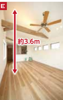
E 約3.6m 気持ちのいい2階リビングは、傾斜天井(最大天井高約3.6m)にして「シーリングファン」を取付ましたダイニングは、レトロデザインの「スポットライト」で照らします