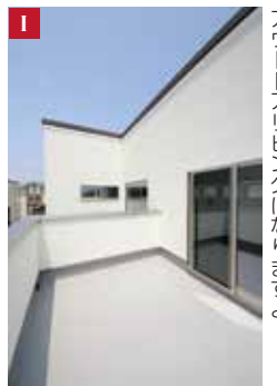
I お天気のいい日は「ルーフバルコニー」がアウトドアリビングになりますよ!