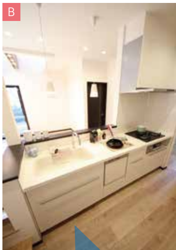
ダイニングとお揃いの ペンダント照明のある「対面キッチン」。