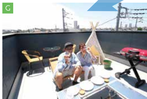
見晴らしの良い「屋上バルコニー」で、 思いっきりアウトドア！ 夏は花火を眺めながら家飲みも楽しめますね。