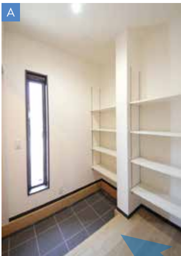
ベビーカーやキッズサイクルも 楽々置ける「シューズクローゼット」です。