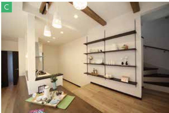
造作の「ダイニングテーブル」は、 床に座ったり…椅子に腰かけたりできますよ！ 背面の「可動棚」は、コレクションを飾ったり…本棚にしたり… 色々な使い方ができますね。