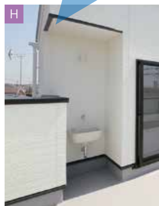
「スロップシンク」があるから、 プール遊びも大丈夫！