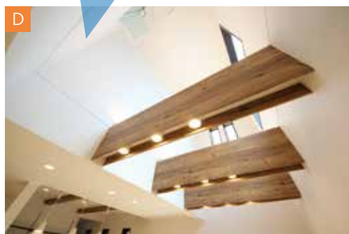
「間接照明で演出した木目の梁」がアクセントの リビングでリラックスしませんか？