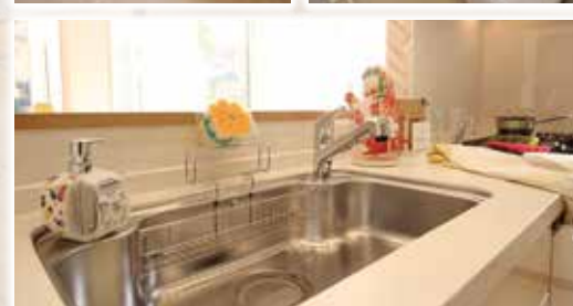
※写真は当社施工例です。